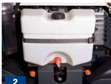
Sistema di abbattimento polveri con serbatoio da 15 L Dust control system with 15 Lt tank