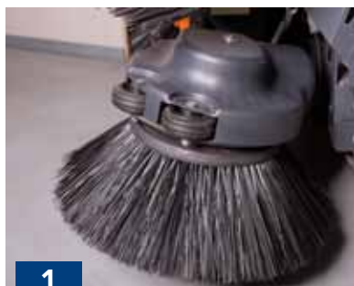
Spazzole anteriori protette da sistema di rientro antiurto. Front brushes protected by mechanical fuse.