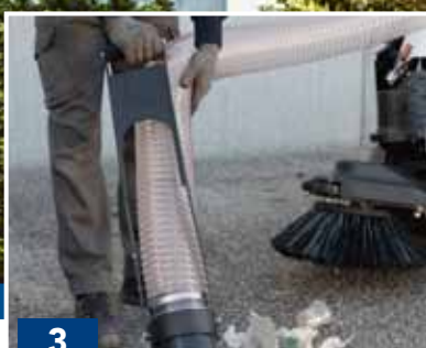
Tubo d'aspirazione ad alta efficienza High efficiency suction hose